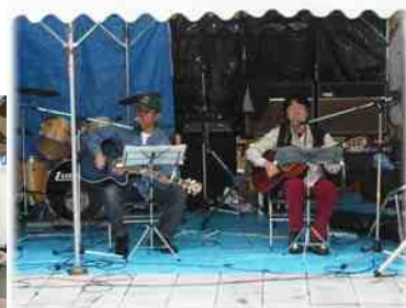
ストリートライブ