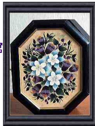
仲重ひとみさん作